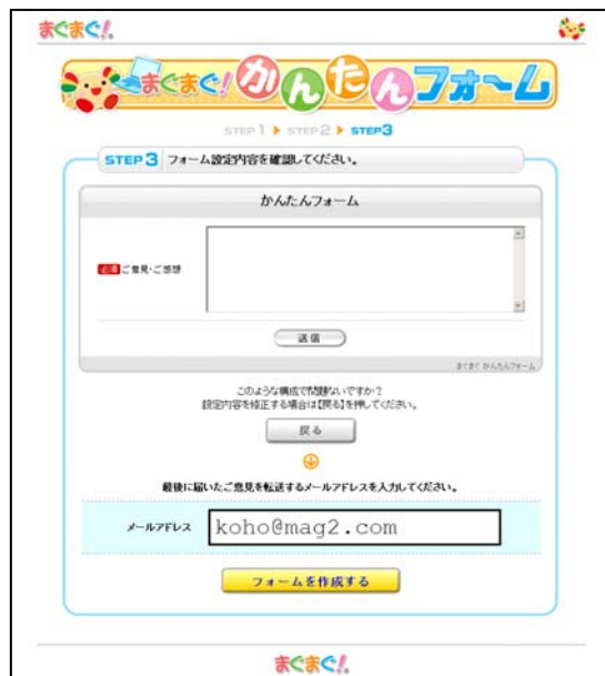
フォーム例【ご意見・ご感想用】