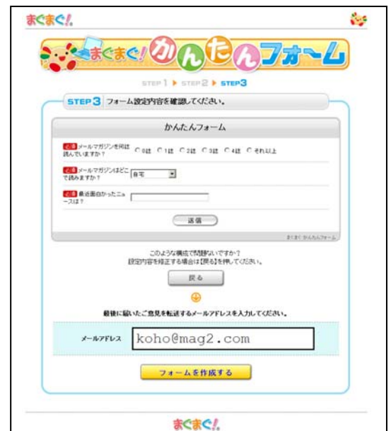
フォーム例【オリジナル項目】