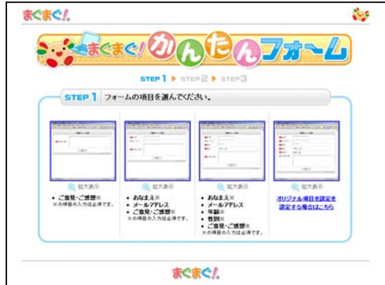
フォームの項目選択ページ